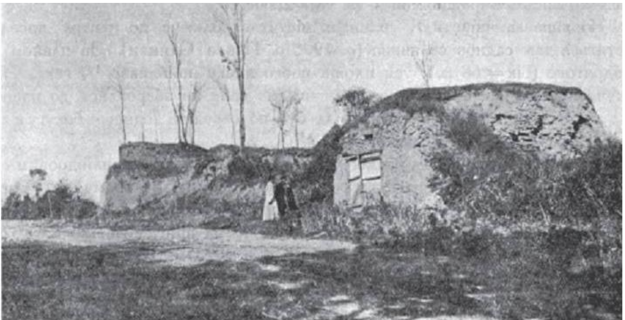
Рештки Ярмолинецького замку.

Після завершення будівництва замку з оборонними спорудами Ярмолинці переводяться до категорії містечок, а в 1455 р. одержують магдебурзьке право. Пізніше в Ярмолинцях побудували ще один замок. Він розмістився ближче до центру.