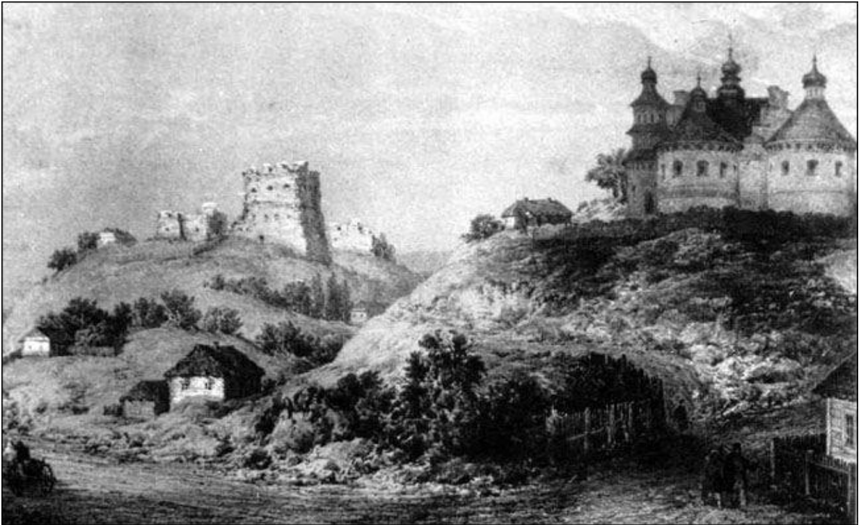
Н. Орда. Церква і замок в с. Сутківці, Ярмолинецького району.