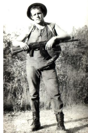
Служба в Афганістані 1983 р.

20 вересня 1982 року призвався в ряди Радянської армії і зразу ж потрапив в карантину зону Узбекистану, де «готували» солдатів до війни в Афганістані. 20 грудня нас доставили на місце в м. Газні, п/п 39676. Мене призначили водієм БТР. Куди везли нас і чого ніхто не знав. До тями прийшли вже на місці. 7 березня 1984 року перевели в іншу частину в м. Кабулі.