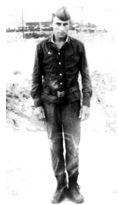
Служба в ДРА м. Баграм 20. 06. 1984 р.