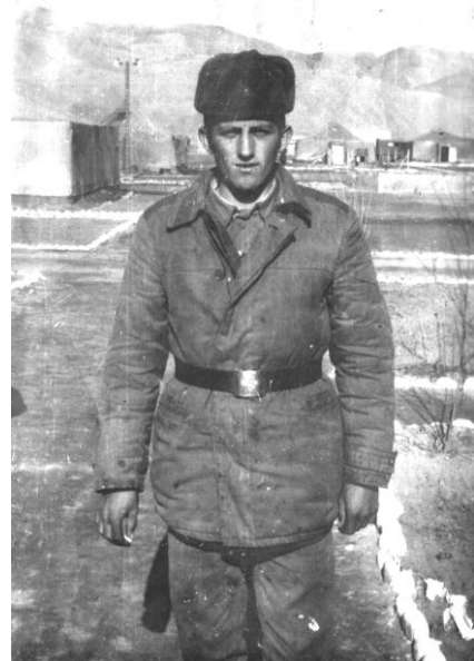
Афганістан 10. 03. 1983 р.

року був призваний до лав Радянської армії. І тут мені доля «подарувала» свій сюрприз. Направивши мене в карантинну зону Узбекистану, полігон «Термез». Там я потрапив в полк 61436, в третю танкову роту, був