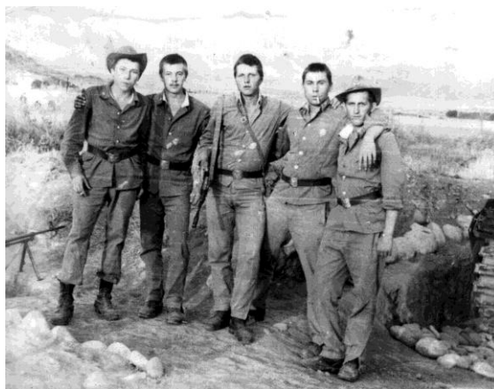
Афганістан. 1983 р. Бойові побратими

Я один з тих радянських солдатів, які були учасниками тієї, як зараз говорять, «безглуздої» війни. Проте кожна війна має свої особливості і війна в Афганістані не була схожа ні на одну іншу. У цієї війни була своя тактика, свої прийоми, свої