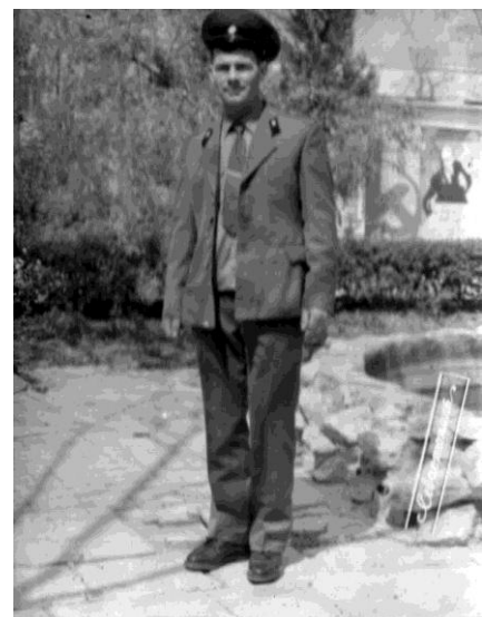
Під час навчання в школі прапорщиків