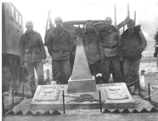
Афганістан. 20. 12. 1983 р. Біля пам'ятника загиблим радянським воїнам