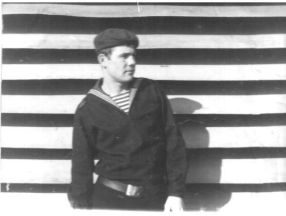
Строкова служба в м. Севастополі

Радянської армії. Служив в м. Севастополі протилодочному крейсері «Москва». 22 листопада 1974 року звільнився з рядів РА і повернувся в рідне село.