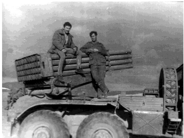
Служба в Афганістані 1980 р.

Хмельницьке артилерійське училище. А в 1986 році прийшла рознарядка на проходження служби в Демократичній Республіці Афганістан. Тут виконував обов'язки старшини артилерійської батареї. Приймав участь в бойових діях.